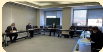
第2回組織部会(2月9日) できるだけ会場を広く使って席を配置。