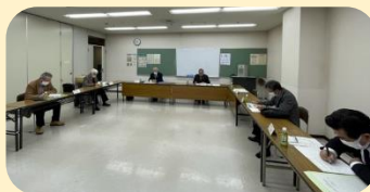
第5回総務部会(2月25日) 会報まちの掲載事項について、第4回書面開催で意見を取りまとめ、第5回集合開催で原稿を最終確認。