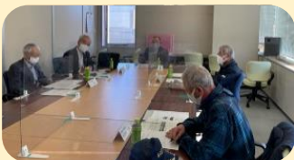
第1回防災部会(11月12日) 対面で座る場合は、正面にも飛沫防止パネルを設置。